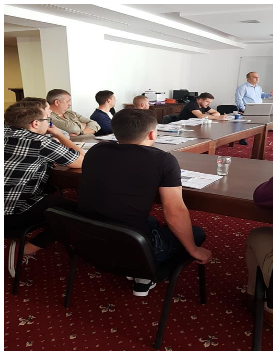
Fig. 2 - Curs Manager Proiect, Durau